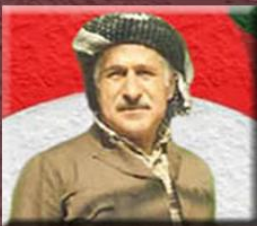
مه‌لا ره‌سوول گه‌ردی