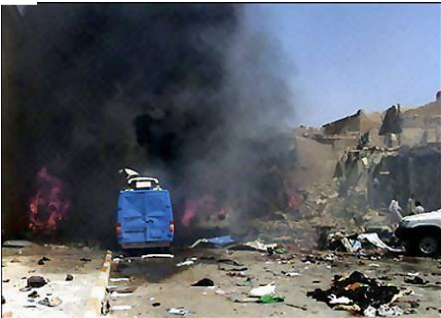
دىمەنىك لە كىردەو تېرۆرىستى يەكانى عىراق

لېپىسراۋە پاىبەرزەكانى عىراق و ھەرۋەدا دىپلۆماتە رۆژئاۋايى يەكان لەسەر تەو كۆن كە ئىران لە پىرۆسىيەكى نىو نەھتى دا بە ھەلپىشتى سول لەبەر دەم جىزىبە سىياسىيە گوپراپەلەكانىيان، دامەرزارە خىزىخازى يەكانى باشورى ولات و رىكخراۋە چەكارو مىلىشياكانى عىراق بە مەبەستى و دەستەھىنانى ھىزىر دەسەلات و برە لە نىو دەسەلاتى نوئى عىراق دا و ك لاىھەنىكى بىدەنگە ھەللا ھەلبژاردنىكى نازاد دا بەشدارى بەكەن و بەجۆرە شىرادەي سىياسىي خۇيان لە پىرۆسىيەكى ديموكراتىك دا بە ھەلبژاردن دىارىكردنى نوئىنەرانى راستەقىنەيان بە