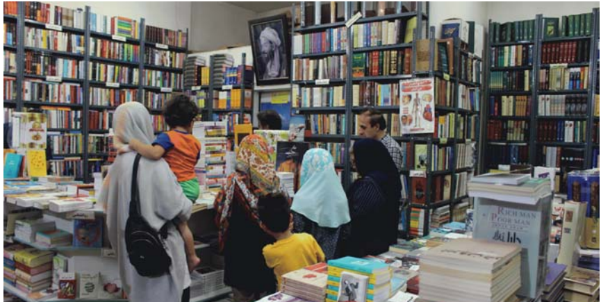
ته‌زانی ده‌چ بکه‌ین؟»