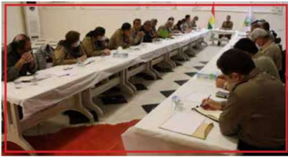
رێبه‌رى حیزبى دیموکراتى کوردستان به مه‌به‌ستى باس و هه‌لسه‌نگاندنى چه‌ند پرسى سىاسى و ته‌شكىلاتى كۆبۆه.

رۆژى پینچ شهممه، ۲۰ ربه‌ندانى ۱۳۹۹ه‌تاوى، هه‌وته‌مین كۆبۆنونه‌وى گۆمیتەى ناوه‌ندى حیزبى دیموکراتى كوردستان، هه‌لیژیرادوى كۆنگره‌ى ۱۷ حیزب به به‌شدارى ئەندامانى ئەسلى، جیكاران و رۆژكارانى گۆمیتەى ناوه‌ندى به‌ریوه‌ چوو. كۆبۆنونه‌وى گۆمیتەى ناوه‌ندى به راگرتنى ساتنك بیده‌نگى بۆ ریزگرتن له یاد و بیره‌وه‌رى شه‌هیدانى حیزب ده‌ستى پى كرد و پاشان به‌ریز خالید عەزیزى، سكرتێرى كشتنى حیزبى دیموکرات، باسینكى سىاسى لسه‌ر كۆمه‌لیك پېشهاات و پرسى سىاسى پبه‌وه‌نیدار به ئێران و كوردستان پېشكەش كرد.