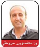
ر: مەنسور مەرۆتی

هەر وەك له ژماره‌كانی پێشدا باس كرا و له ژماره‌كانی داهاوتوشدا وەك زنجیره باس به‌راجواتان ده‌كه‌وێ، له دیکتاتۆریهوه تا دیموکراسی ناوی توێژینه‌وه‌یه‌كی "جین شارب"، بیرمه‌ندی ناواری بواری خه‌باتی مه‌ده‌نی و ئاتۆدۆتیۆده. شارب سالی ۱۹۲۸ له ژهاپۆی ئامریكا له‌دايك بووه، دوكتۆرای فه‌لسه‌فه‌ی سیاسیی بووه و چیا له ماموستایه‌تی له زانكۆی ئامریكا، بو لیکۆلینه‌وه له سه‌ر خه‌باتی ئاتۆدۆتیۆ سه‌ردانی ژۆر و لاتی كرده و ته‌نانه‌ت ژۆر جاریش بو پهره‌ده‌كردنی خه‌لك سه‌ری له ولاتانی دیکتاتۆریه‌دارو هه‌ڵبژێوانه و له‌وه گرینگتر له چه‌ند ولاتیك خۆی گه‌یاندوه‌ته ریزی پێشه‌وه‌ی ئارازیبیان و تیکه‌ل به خه‌لكی ئازادببخواری شه‌و ولاتانه شه‌و بووه. كاكلی ئیده‌كانی جین شارب شه‌وه‌یه كه "دیکتاتۆره‌كان هیزی سه‌ره‌كیی خۆیان له گوێرايه‌لی و ملکه‌جیی خه‌لكه‌وه وده‌ست دینن، شه‌گه‌ر خه‌لك ئاوا ملکه‌ج و گوێرايه‌لی ده‌سه‌لاداران نه‌ین ده‌توانن دیکتاتۆره‌كان به چۆكدا بێنن یا ده‌نا مه‌جبوو به ئالوگۆریان بکه‌ن". لعم زنجیره باسه‌دا باس له بنه‌ما فیکریه‌یه‌كانی "جین شارب" بو خه‌بات دزی دیکتاتۆری ده‌كرێ: